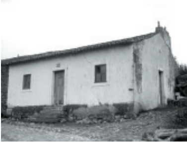
Casa de los padres de Lucia