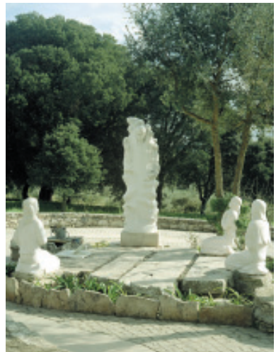
Monumento sobre el pozo de la familia de Lucia que representa la segunda Aparición del Ángel