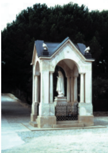
Capilla construida en el lugar de la Aparición de los Valinhos