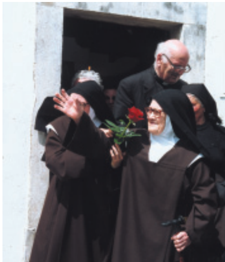
Lucia visita la casa familiar y los lugares de las Apariciones el 16.5.2000