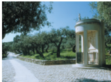
El Vía Crucis húngaro en el "camino de los Pastorcitos" une la Cova da Iría a los otros lugares de las Apariciones