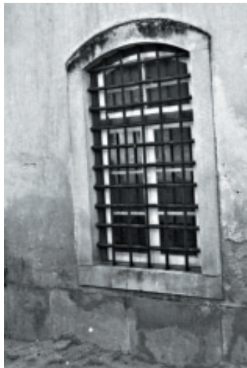
Ventana de la cárcel de Vila Nova de Ourém hasta donde fueron llevados los Pastorcitos el 13.8.1917.