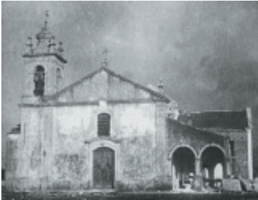
Iglesia parroquial de Fátima en el tiempo de las Apariciones.