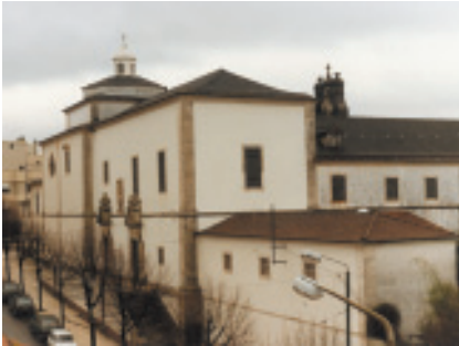
Carmelo de Coimbra donde vivió Lucía del 25.3.1948 al 13.2.2005