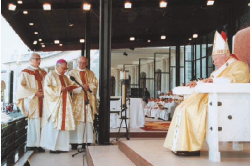
Momento solemne de la beatificación de Francisco y Jacinta el 13.5.2000