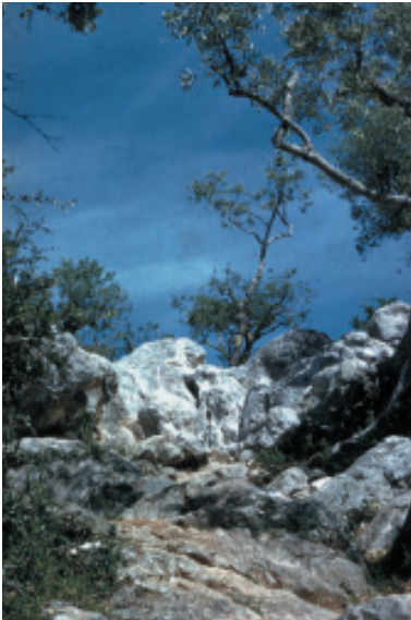
Loça do Cabeço