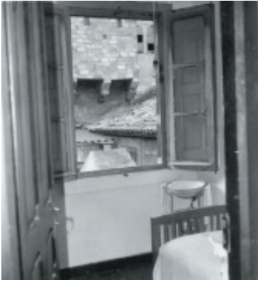
Pontevedra – habitación de Lucía donde el 10.12.1920, Nuestra Señora pidió la comunión reparadora de los primeros sábados