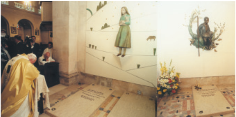
Después de beatificar a Francisco y Jacinta, Juan Pablo II visita las tumbas de los nuevos beatos