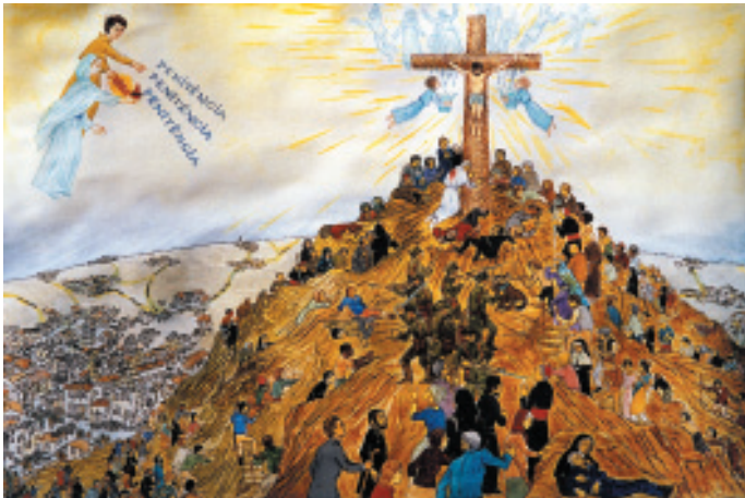
Representación de la tercera parte del secreto de Fátima según las indicaciones de la Hermana Lucia (Júlio Gil)