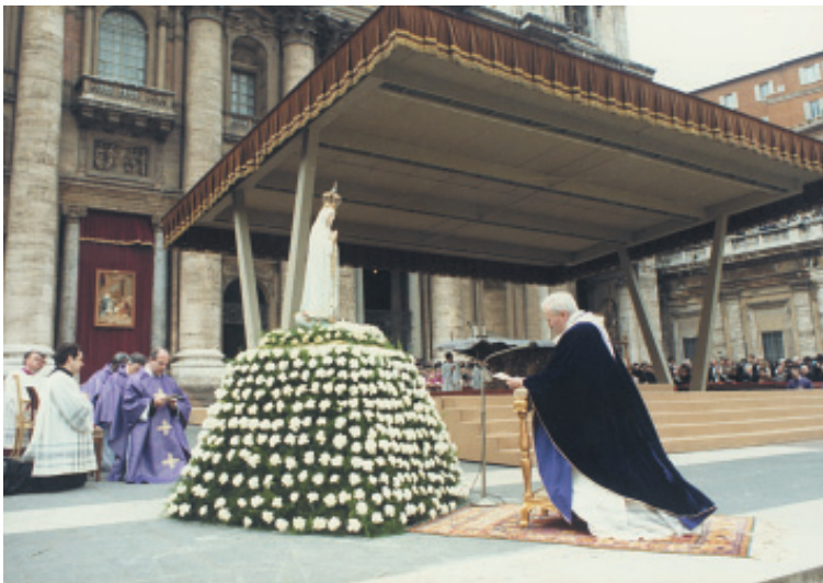
En Roma, delante de la Imagen de la Capillita, Juan Pablo II, en unión con los obispos de la Iglesia, renovó la Consagración del mundo y de Rusia al Corazón Inmaculado de María.