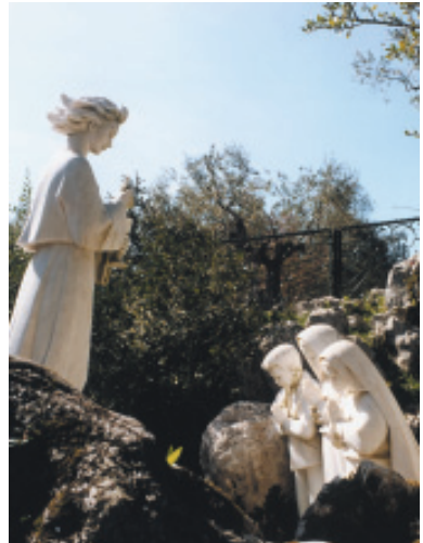
Monumento en la Loça do Cabeço que representa la tercera Aparición del Ángel