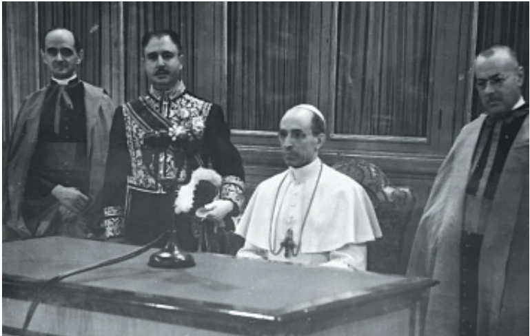
Para cumplir el encargo de Nuestra Señora, Pio XII consagró, el 31.10.1942, todo el género humano al Corazón Inmaculado de María