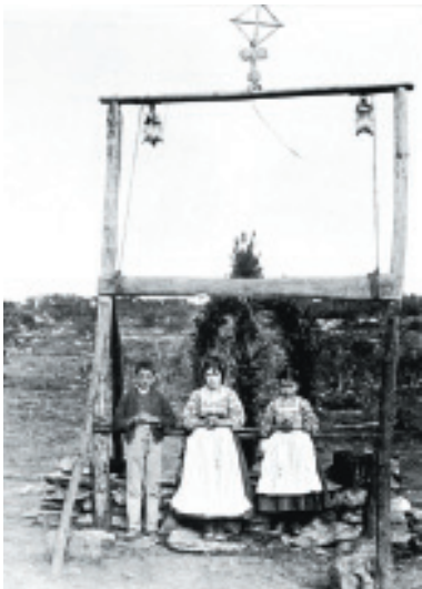
Los tres Pastorcitos junto al arco levantado en el lugar de las Apariciones el día 13.10.1917.