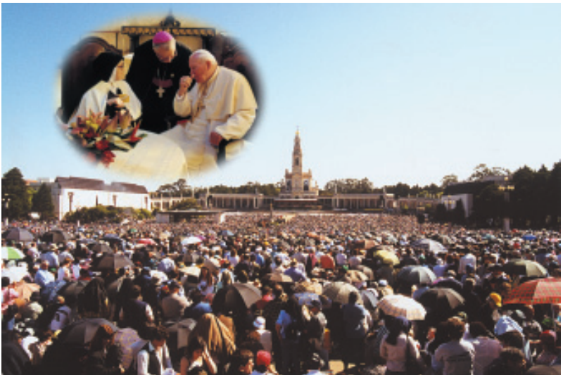
Encuentro de Lucia con Juan Pablo II el 13.5.2000 En el momento de la beatificación la inmensa multitud aplaude calurosamente a los nuevos beatos