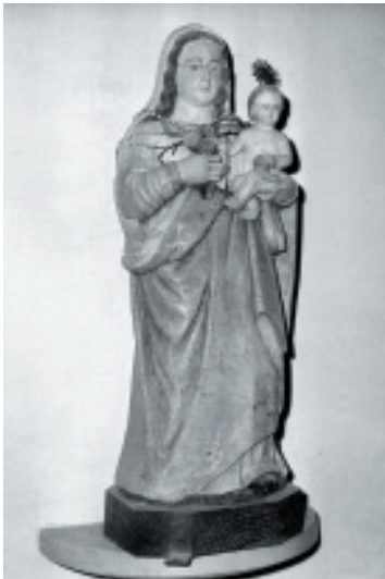
Imagen de Nuestra Señora del Rosario en la iglesia parroquial