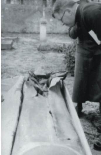
El cuerpo incorrupto de Jacinta tras la apertura de su féretro el 12.9.1935