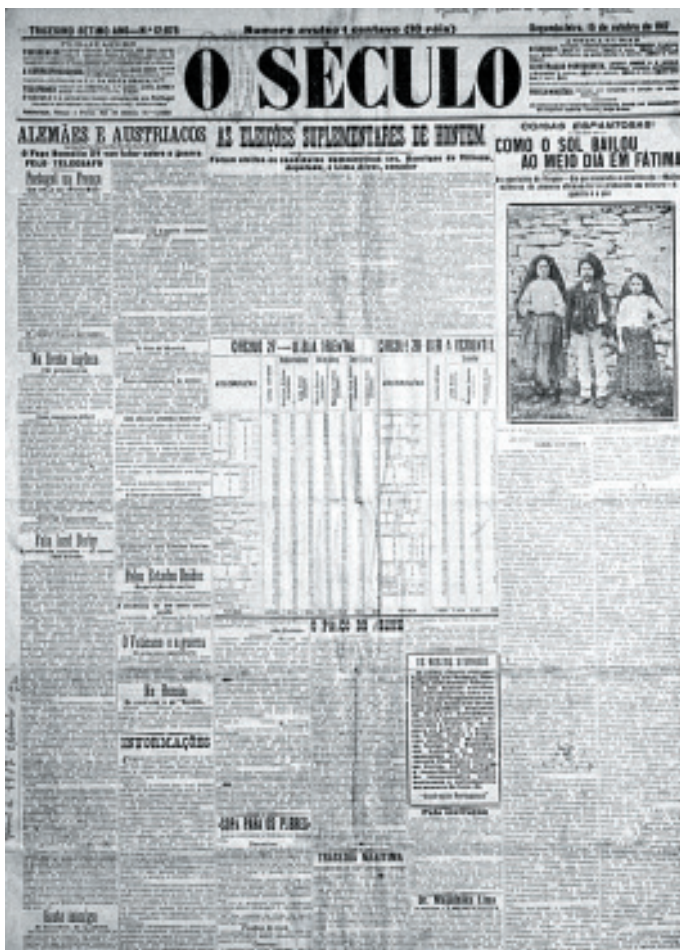
El diario O Século , publicado el 15.10.1917, presentaba por primera vez la fotografía de los Pastorcitos y daba a conocer a todo el país “cosas espantosas: como el Sol bailó al mediodía en Fátima”