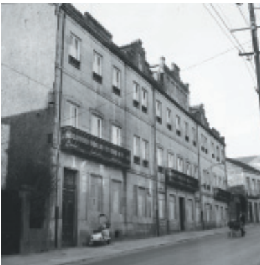
Convento de las Doroteas en Tuy donde el 13.6.1929 Nuestra Señora pidió la consagración de Rusia