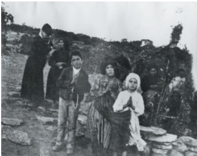
Los tres videntes, Francisco (9), Lucia (10) y Jacinta (7), en el lugar de la pequeña encina sobre la cual se apareció la Santísima Virgen en los días 13, de mayo a octubre de 1917.