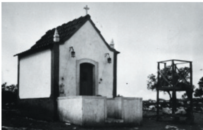
Capillita construida por el pueblo en 1918, en el lugar de las apariciones.