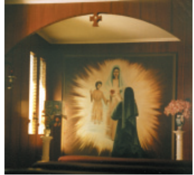
Aspecto actual de la habitación transformada en capilla