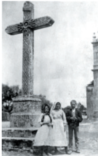
Los tres Pastorcitos junto al crucero, en el atrio de la iglesia parroquial.